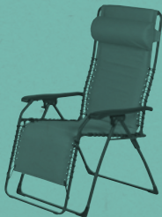
MOVIDA XL SOFT